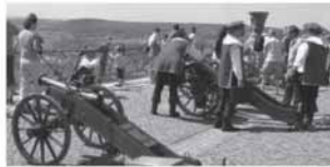
Prie Reino polkėjusio šventinės salvės vaikavo kelionės įpūdžius.

2010-06-11 Tauragės apskrities ir miesto laikraščio „Tauragės kurjeris“ tinklapyje spausdinamas Eugenijaus Skipičio straipsnis „Svečiuose pas Rydštato bičiulius Vokietijoje“, kuriame minima D. Survilaitė, skaičiusi Rydštato ligoninėje pranešimą ( http://www.kurjeris.lt/article/view/9218 ).