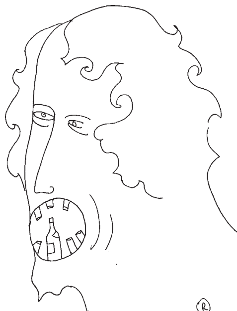
Rimtauto Oškučio piešinys.