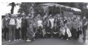
Rydštato ir Tauragės žmonių šeimose išsikėlidę draugystės žiedai sutvirtinti susitikimų džiaugsmu ir išisikyrimų lūdesiu

Per lietus plūstančią Lenkiją beveik 1,5 tūkstančio kilometrų turėjus įveikti autobusas pamažu vinguriavo Rydštato kryptimi. Lenkijos keliai vairuotojams vis dar žavesio nekelia. Tauragės Vokietijos bičiulių draugijos nariai garsiai aptarinėjo iš ten gyvenančių savo pažįstamų gautas naujienas arba stebėjosi sparčiai besikeičiančiais Lenkijos vaizdais. Asbestinio šiferio keitimo programa ir namų renovavimas Lenkijoje tiesiog vos ne per metus pakėitė mažų miestelių ir kaimų vaizdą. Per autobuso langą nesunku pastebėti čia klestintį smulkųjį verslą, nes kiekviename pakelės kaime, o dažnai ir kieme, siūloma kokia nors prekė ar paslauga. Panašu, kad skalūnų dujos iš tikrųjų Lenkiją išvaduos iš energetinės priklausomybės nuo „Gazpromo“. Amerikiečių vertinimais, iš visoje Lenkijos teritorijoje esančių skalūnų galima išgauti net 3 trilijonus kubinių metrų dujų. Visos Lenkijos metinis poreikis sudaro 14 mlrd. kubinių metrų. Jei amerikiečių prognozės pasitvirtintų, dujų atsargų užtektų maždaug 200 metų, o Lenkija galėtų ateityje atsikratyti priklausomybės nuo Rusijos ir net eksportuoti dujas. Dabartiniu metu Lenkija importuoja 73 proc. dujų, reikalingų šalies poreikiams tenkinti. Kai lenkų kiemuose pamatai baltai šviečiančius miniatiūrinius dujų rezervuarus, pradėti galvoti, kad šios šalies energetinės nepriklausomybės diena visiškai netoli.