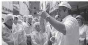
Berrių makuaronų gamyboje.