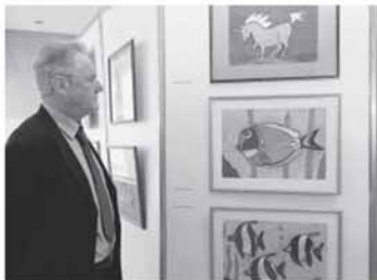
[G] Bilder psychisch Kranker aus Litauen sind im Festsaal des Riedstädter Philipphospitals zu sehen.