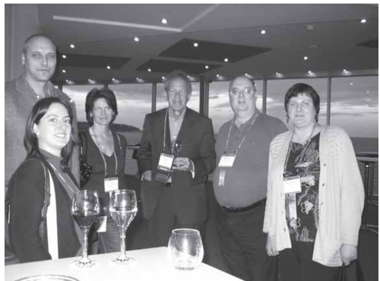
Pacientų organizacijų atstovai.

Suvažiavime susipažinau su keliomis skėtinėmis Europos organizacijomis. Tai EMA ir EURORDIS. EMA (angl. European Medicines Agency – Europos vaistų agentūra) nuo pat savo įsikūrimo (1995 m.) atsako už tarimąsi su Europos pacientų organizacijomis. Ji pripažįsta, kad vaistų vartotojai sukaupę ypatingų žinių ir patirties, dėl to jų nuomonė tokia svarbi. EMA atsakinga ir už kokybiškos, tikslios ir pacientams